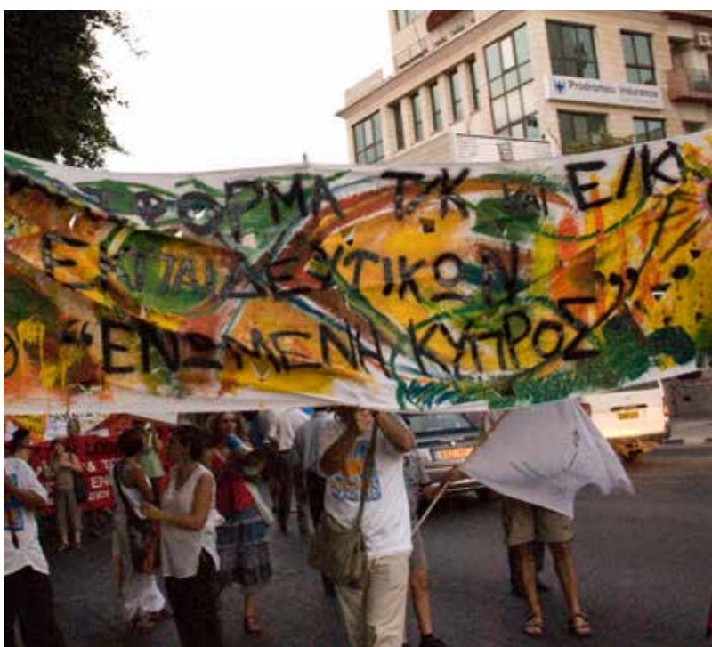
Δικαιοτική Πορεία Ειρήνης, 1 Σεπτεμβρίου 2010